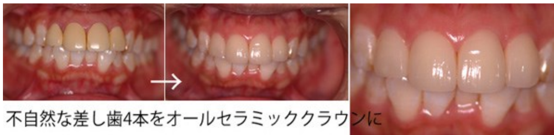
不自然な差し歯4本をオールセラミッククラウンに

周りの歯から浮いて見える不自然な差し歯や根元が黒ずんでしまった差し歯は、どうしても気になってしまいます。オールセラミッククラウンで自然な見た目に戻すことができます。