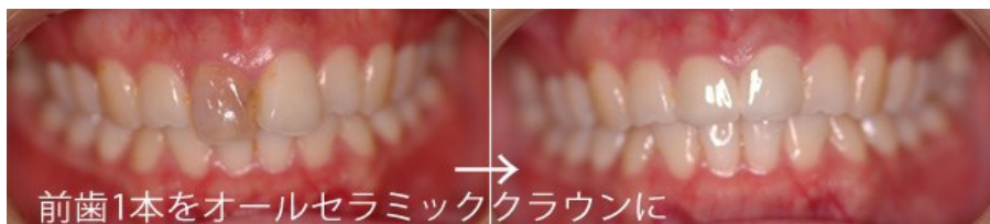
前歯1本をオールセラミッククラウンに

オールセラミッククラウンだと、自然な見た目で、人の視線も気にならず、笑顔に自信が持てるようになります。