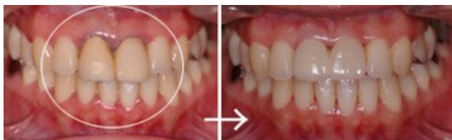
歯ぐきの黒ずみは、金属を使わないオールセラミッククラウンに交換

写真を見比べてみると、自分の元々の天然歯とまったく変わりが無く、健康そのものに見えますね。印象が全く違ってきます。